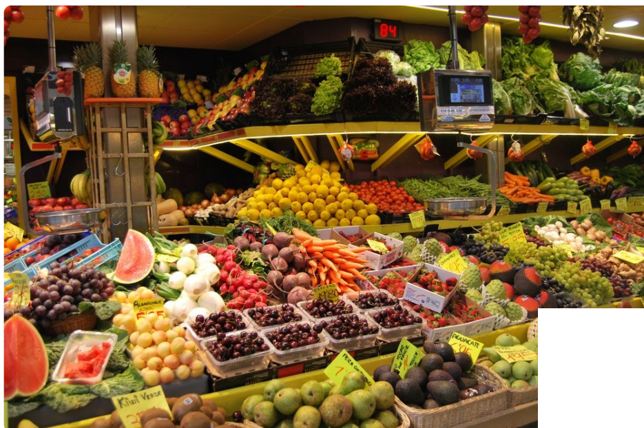
Mercat de l'Olivar / Archivo fotográfico del Mercat de l'Olivar

Los productos vegetarianos y veganos también se encuentran en los mercados tradicionales