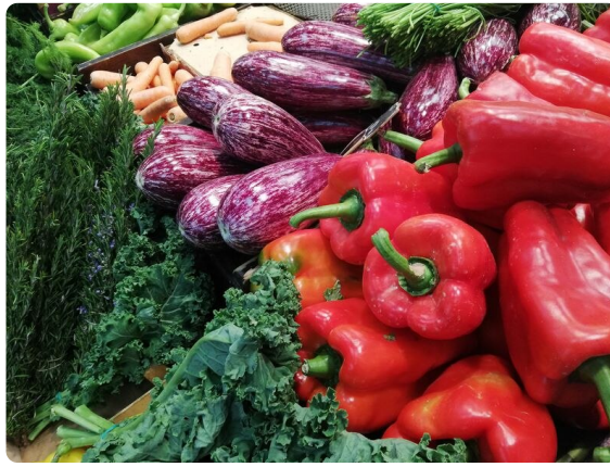
Mercat de l'Olivar

Por otro lado, los beneficios para la salud, en un contexto donde los hábitos saludables cada vez importan más, el respeto a los animales y al medio ambiente, en un momento donde Europa ha declarado la emergencia climática, son varios motivos más por los cuales el Mercat de l'Olivar satisface esta demanda actual. Además, los compradores son cada vez más exigentes con los productos que incluyen en la lista de la compra. Por ello, es necesario que existan estos emplazamientos en los que cada producto se convierte en una seducción para el paladar sin tener, por ello, un precio prohibitivo.